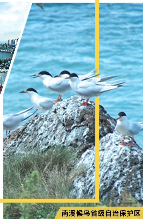
南澳候鸟省级自治保护区